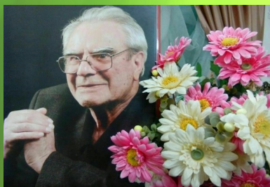
روانشاد دکتر غلامحسین شکوهی پدر تعلیم و تربیت نوین